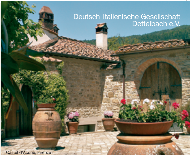
Castel d'Acone, Firenze